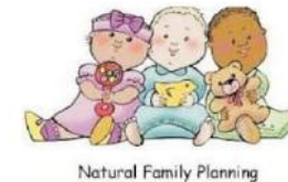
Natural Family Planning